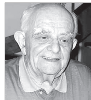
Miloš Pick (1926) je makroekonom.

Zde uvedené náměty se nepokoušejí nabídnout k tomu kuchařku, jsou jen podnětem k zamyšlení.