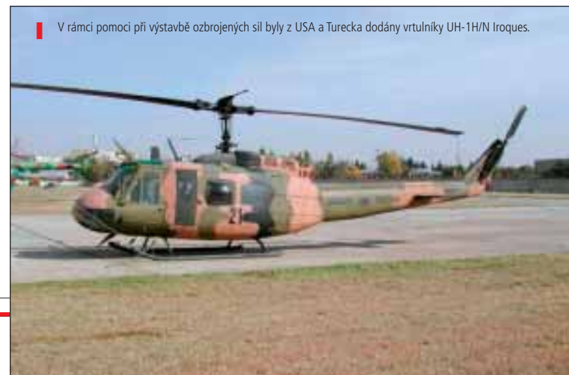
! V rámci pomoci při výstavbě ozbrojených sil byly z USA a Turecka dodány vrtulníky UH-1H/N Iroquois.

třídy La Combattante II, dodaný z Řecka v roce 2004, vyzbrojený čtyřmi protilodními střelami Exocet MM.38, dvěma 35 mm dvouhlavňovými kanóny Oerlikon a dvěma torpédometry. Z Ukrajiny pochází raketový člun „Tbilisi“ (302) Project 206MR Matka, předaný Gruzii v roce 1999, vyzbrojený dvěma protilodními střelami P-15M Termit, 76 mm kanónem AU-176 a šestihlavňovým 30 mm kanónem AK-630M. Dalšími plavidly jsou čluny „Batumi“ (301) Project 205P, „Akmeta“ (102) Project 368T. Řecko přenechalo Gruzii dva čluny „Iveria“ (201) a „Mestia“ (203) a z Turecka byl v roce 1998 dodán hlídkový člun „Kutaisi“ (202). Dále jsou zde čluny Projektu 360 „Cchaltubo“ (101), „Gantiadi“ (016) a „Gali“ (04), bulharské malé výsadkové čluny Project 106K „Guria“ (001) a „Atia“ (002) a další dvě plavidla Project 1176 (MDK-01 a MDK-02) bývalé Černoamořské flotily a několik dalších malých pomocných plavidel. Pobřežní ochrana disponuje minolovkou P-22 Aeti (bývalý M 1085 Minden třídy Lindau) předanou v roce 1998 Německem, hlídkovou lodí P-101 Kodori, ukrajinskou hlídkovou lodí P-21 Georgij Topeli (Project 205P), osmi čluny Project 1400M