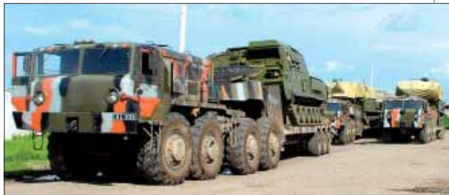
■ Armáda je vyzbrojena převážně bojovými vozidly BMP-1 a BMP-2 a obrněnými transportéry BTR-80.

BMP-1, 120 BMP-2, 75 kolovými obrněnými transportéry BTR-80 8x8, 64 pásovými obrněnými transportéry MT-LB a asi stovkou lehkých kolových obrněných vozidel Otokar Cobra 4x4. Tažené dělostřelectvo mělo ve výzbroji kanony 2A36 Giatsint-B ráže 152 mm (12), 2A65 Msta-B ráže 152 mm (18) a 2A18 ráže 122 mm (120), ze samohybného dělostřelectva pak kanony 2S7 Pion ráže 203 mm (12), 2S19 Msta-S ráže 152 mm (3), 2S3 Akacija ráže 152 mm (26) a kanonovými houfnicemi Vz. 77 Dana ráže 152 mm (24). Z raketometných systémů byly v inventáři raketometry RM-70 ráže 122 mm (48), BM-21 Grad ráže 122 mm (120) a LAR-160 ráže 160 mm (15). Z minometů byly ve výzbroji 240 minometů 2B11, 365 M-38/43 a 250 M75, všechny ráže 120 mm. Pokud jde o ruční zbraně, disponují příslušníci gruzínských ozbrojených sil americkými M4A3 (Colt RO977), ruskými AKM/AKMS, AK-74, AKS-74U, speciální jednotky