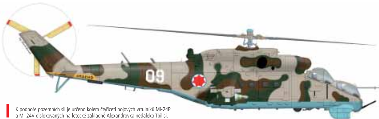
! K podpoře pozemních sil je určeno kolem čtyřiceti bojových vrtulníků Mi-24P a Mi-24V dislokovaných na letecké základně Alexandrovka nedaleko Tbilisi.

Dalším přístavem je Batumi. Námořnictvo disponuje menšími plavidly různých tříd a typů. Organizačně je rozděleno na námořní eskadru a jednotku speciálních sil námořní pěchoty dislokovanou v Poti. K největším a nejsilněji vyzbrojeným plavidlům gruzínského námořnictva patří raketový člun „Dioskuria“ (303)