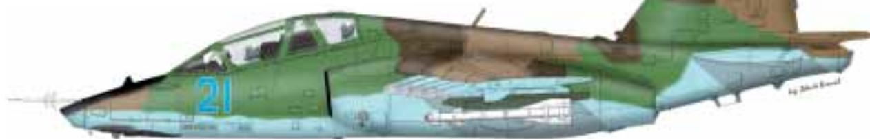
! Páteř letectva tvoří dvoumotorové proudové bitevní letouny Su-25, které gruzínský letecký závod TAM ve Tbilisi sériově vyráběl pro sovětské letectvo a zahraniční uživatele.

ni Mi-8T/MTV-1 (16), UH-1N (36), UH-1H (6) dodané z USA a Turecka a Mi-2 (2). Do výzbroje patří také izraelské bezpilotní letouny Elbit Hermes 450.