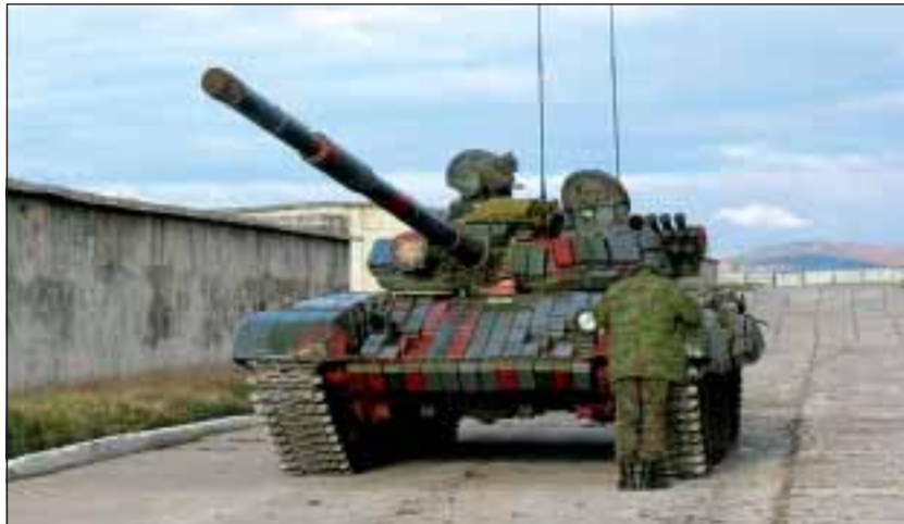
■ Téměř 250 středních tanků T-72B1/M/AB a T-55AM tvoří největší sílu pozemních sil.

Pozemní síly jsou organizačně členěny do brigád, praporů a samostatných praporů.