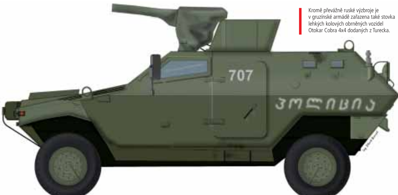
■ Kromě převážně ruské výzbroje je v gruzínské armádě zařazena také stovka lehkých kolových obrněných vozidel Otokar Cobra 4x4 dodaných z Turecka.

pak německými G36K a izraelskými Tavor TAR-21, kulometry PK, NSV a Mk 19 Mod 3, odstřelovacími puškami pak SVD, Remington 700, Zastava M93 Black Arrow ráže 12,7 mm a izraelskými Barrett M82A1.