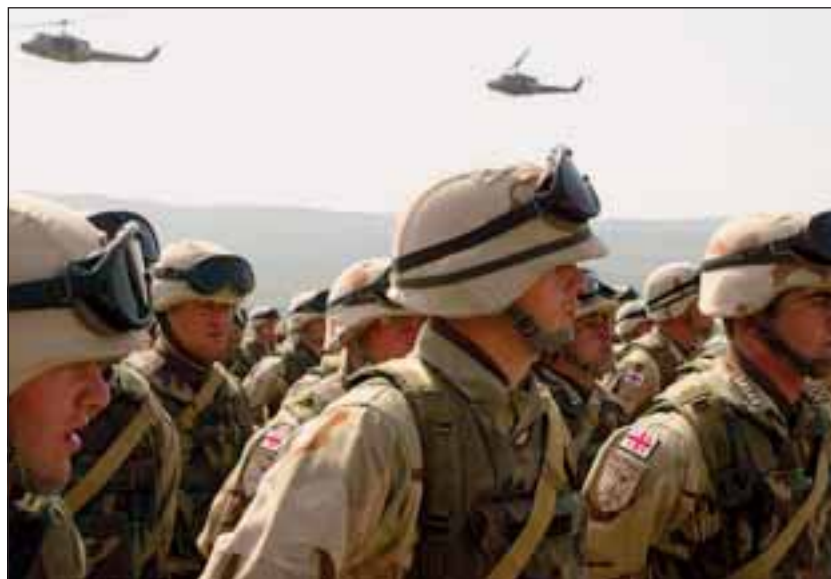
Do zahraniční mise v Iráku vyslala Gruzie 2 000 vojáků, dalších 50 je nasazeno v Afghánistánu.

NATO a řada jeho členů a partnerů pomáhá při výstavbě a výcviku nové gruzínské armády. Od roku 2005 byla například nákladem 15,6 mil. EUR podle standardu NATO vybudována již zmíněná základna Senaki, letos byla uvedena do provozu podobná základna v Gori. Na dodávkách zbraní se podílela zejména Ukrajina, Izrael, Česká republika, Turecko, USA a Bulharsko. Při výcviku pomáhají především USA, Velká Británie, Izrael a Francie.